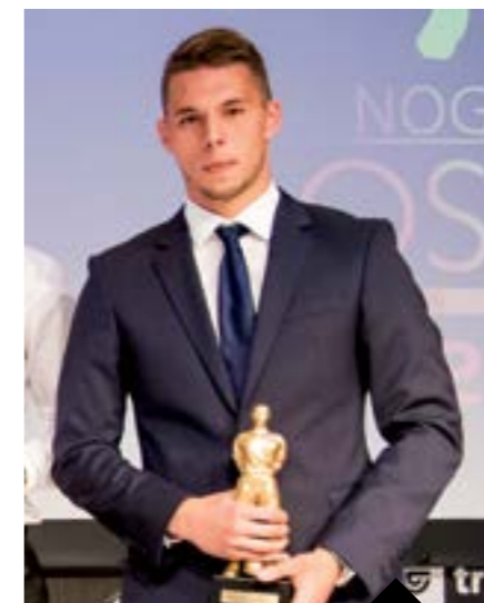
NAJ IGRAČ HNL-A MARKO PJACA