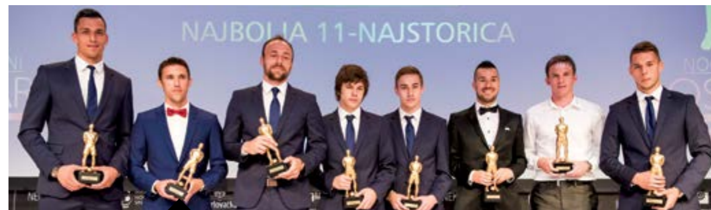
NAJ MOMČAD GODINE (433) LOVRO KALINIĆ - STEFAN RISTOVSKI, MARKO LEŠKOVIĆ, GORDON SHILDENFELD, JOSIP PIVARIĆ -TINO SVEN SUŠIĆ ANTE ČORIĆ, MARKO ROG - MARKO PJACA, ILIJA NESTOROVSKI, MARIN TOMASOV